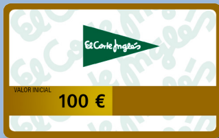
Tarjeta El Corte Inglés valor de 100 €

Tan fácil es domiciliar su nómina en Deutsche Bank como elegir entre 1 :