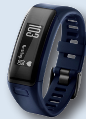
Pulsera Actividad GARMIN Vivosmart HR Notificaciones inteligentes