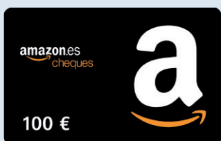
Tarjeta Amazon valor de 100 €

Tan fácil es domiciliar su nómina en Deutsche Bank como elegir entre 1 :