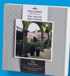
Pack Paradores Alojamiento y desayuno para dos personas