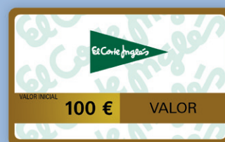
Tarjeta El Corte Inglés valor de 100 €